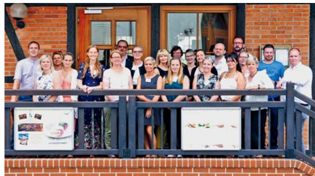
Die „Konfliktberater mit System“ trafen sich Anfang Juni gemeinsam mit Unterstützern und ihren Führungskräften zur Zertifikatübergabe in Halle (Saale)

Wir vom Bildungswerk sind dankbar für die Erfahrungen, die wir während der Qualifizierung mit allen Engagierten aus unserem vielfältigen Verband sammeln durften und freuen uns, auch künftig gemeinsam für Zusammenhalt und Teilhabe einzustehen.