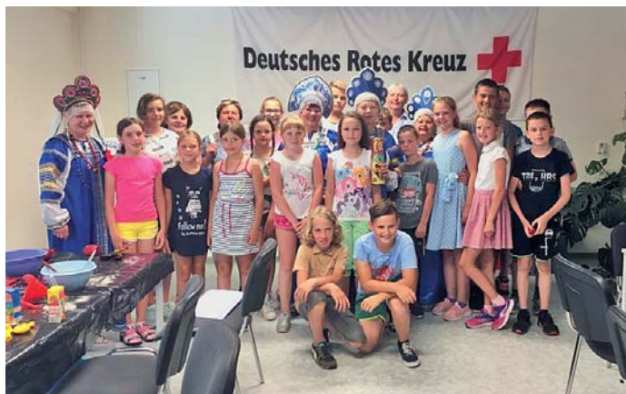
Die Kinder zu Gast im DRK-Mehrgenerationenhaus