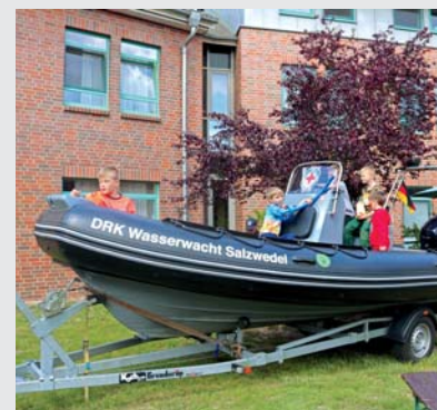
Die Kinder enterren das Rettungsboot der DRK-Wasserwacht