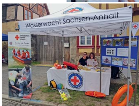
Der Ministerpräsident Sachsen-Anhalts Reiner Haseloff besuchte das DRK auf dem Sachsen-Anhalt-Tag