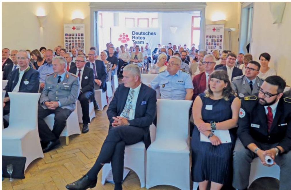
Zahlreiche Gäste aus Politik, Justiz, Militär und Zivilgesellschaft waren zur Veranstaltung gekommen