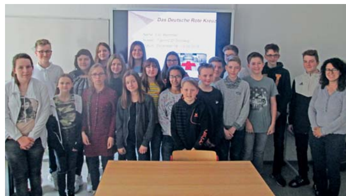
Schüler der ehemaligen 5. Klasse der Christophorusschulen Droyßig (CJD)