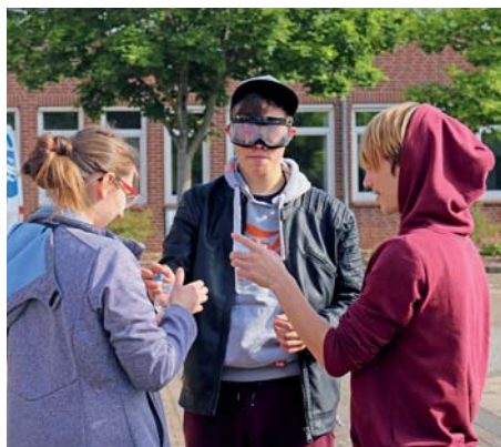
Mit der Rauschbrille kann auch ein Glas Wasser zur Herausforderung werden

Ein Schüler wankt die Treppen zum Schulhof hinunter. Als er über einen Karton steigen soll, stolpert er, und beim Einschenken