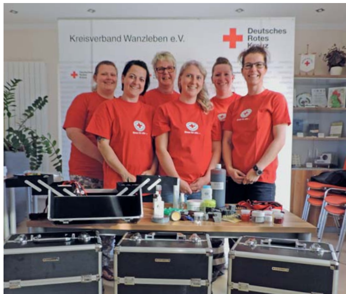
Sechs der insgesamt sieben ausgebildeten ehrenamtlichen Helfer aus dem Team Notfalldarstellung des DRK-Kreisverbandes Wanzleben

Das neue Wanzleber Team Notfalldarstellung kommt seit seiner Gründung nunmehr regelmäßig zum Üben und Ausprobieren zusammen. Finanzielle Mittel aus der vergangenen Weihnachtsspendensammlung machten es möglich, für jeden Ehrenamtlichen