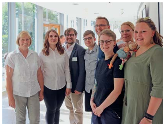
Die AG KinderSommer bei der Ausstellungseröffnung im Landtag mit Landtagspräsidentin Gabriele Brakebusch (links)

Bis Ende August konnte man im Landtag Sachsen-Anhalt die Ausstellung „30 Gesichter und Geschichten aus dem KinderSommer“ sehen. Die Plakatserie wurde anlässlich des 30-jährigen Bestehens der integrativen Ferienfreizeit erstellt. Die Plakatserie zeigt verschiedene Charaktere und Personen, die durch, im und mit dem KinderSommer