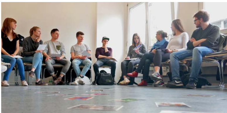
Die Lehramts-Studierenden der MLU lernen gemeinsam etwas über das Glück